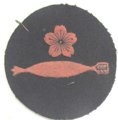
Badge met kerselarenbloesem voor een matroos

De mannequin rechts draagt het uniform voor een eerste matroos elite-kanonnier (UNYO HO) van de Japanse keizerlijke Marine . Let op de typische leder schort, de streep voor goed gedrag op de arm en de kerselarenbloesem, het Japanse kenteken dat uitzonderlijk gedrag in een militaire functie belooft.