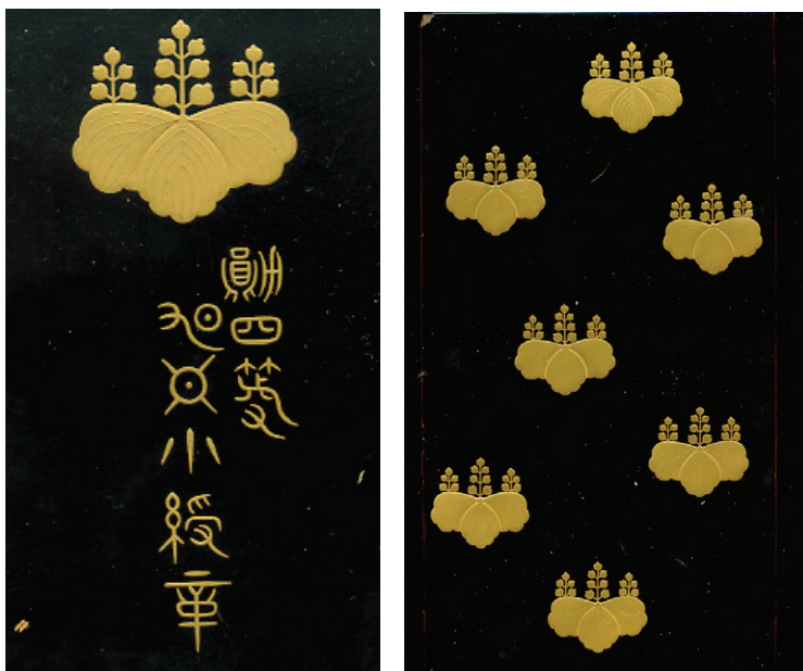
Details van het kistje van de Orde van de Rijzende Zon