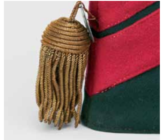
Politiemuts voor een hogere stafofficier, vreemd genoeg voorzien van een kwast voor lagere officieren.