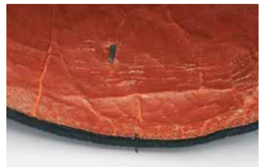
Politiemu 1913 voor lagere officieren van de trein en de artillerie te paard.