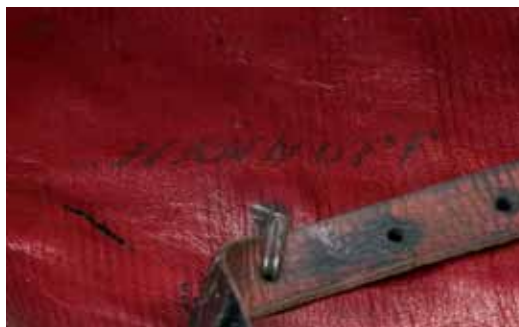
Politiemuts M 1913 voor een infanterieofficier en aanhechtingssysteem van de stormband.