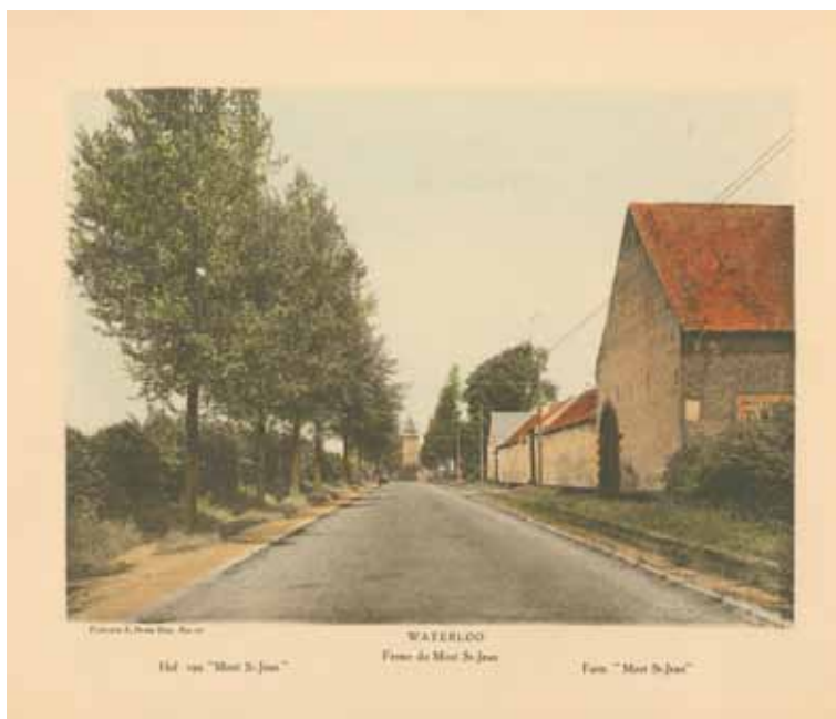
Waterloo: Hof van Mont St-Jean - Ferme de Mont St-Jean - Farm Mont St-Jean

Potloodschets op calqueerpapier door Jacques Madyol (19 de eeuw) Esquisse au crayon sur papier calque par Jacques Madyol (19 e siècle) Pencil draft on tracing paper by Jacques Madyol (19 th century) KLM-MRA 201410205