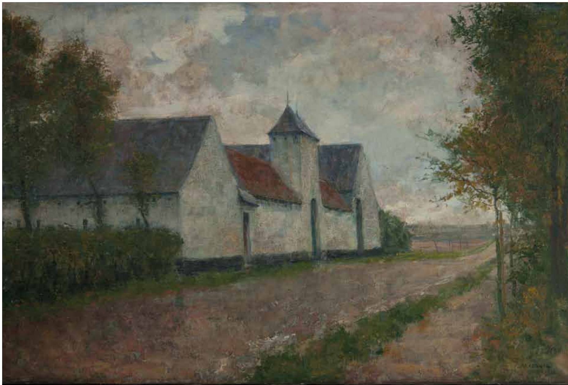
Olieverfschilderij: Hoeve Mont-St.-Jean te Waterloo door Jacques Madyol (1910) Peinture à l'huile : Ferme de Mont-St.-Jean à Waterloo par Jacques Madyol (1910) Oil Painting: Mont-St.-Jean Farm in Waterloo by Jacques Madyol (1910) KLM-MRA 401043