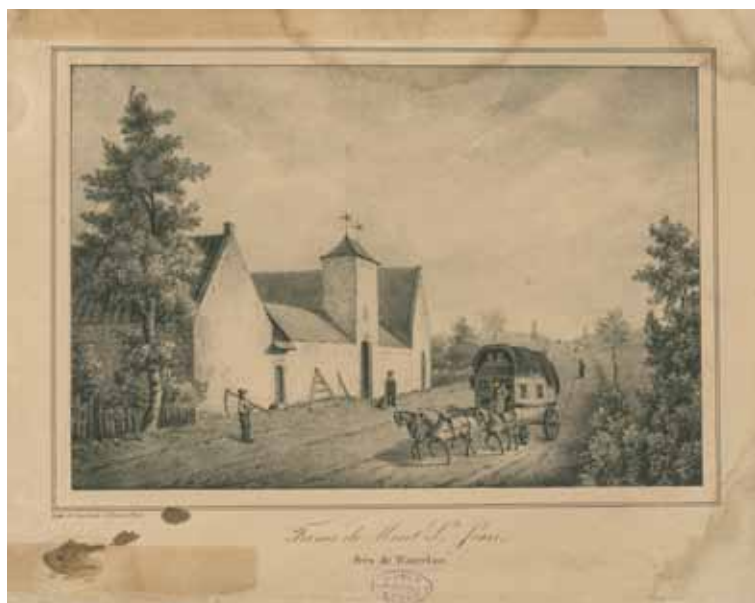
Ferme de Mont St. Jean, près de Waterloo

Steendruk op papier door H. Gérard (1842) Lithographie sur papier par H. Gérard (1842) Lithography on paper by H. Gérard (1842) KLM-MRA 201410260