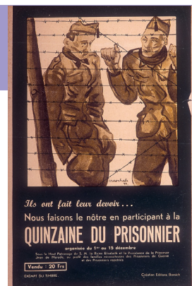
Craenhals, 1944

Tijdens de gevechten in België worden zo'n 50.000 Belgische militairen gevangen genomen en na de capitulatie komen daar nog eens 175.000