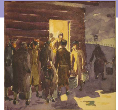
E.G. Hofmans, Keuken van een krijgsgevangenen-kamp, Stalag XII D (Trier, Duitsland) © WHI, Brussel

De officieren worden opgesloten in aparte kampen, de Oflag ( Offizierlager , officierkampen); de onderofficieren, korporaals en soldaten in de Stalag ( Stammlager , basiskampen). Die laatste groep wordt als enige verplicht tot dwangarbeid in boerderijen, bosbouwbedrijven of fabrieken. Vanaf juli 1940 kondigt Hitler de vrijlating aan van de Vlaamse krijgsgevangenen, een beslissing die kadert in het plan om een nieuwe Flamenpolitik te ontwikkelen. Enkelen zullen dit aanbod afwijzen. Veel soldaten zullen in de loop van de oorlog om medische redenen naar huis kunnen terugkeren. Zo'n 60.000 Belgische krijgsgevangenen herwinnen hun vrijheid in 1945. Bijna 1.680 manschappen overlijden tijdens hun gevangenschap.