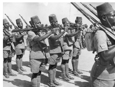
Openbare Weermacht, Congo, 1940-45

Op het militaire vlak levert de Congolese Openbare Weermacht ( Force Publique ) een niet te verwaarlozen bijdrage: 15.000 soldaten en 25.000 dragers worden eind 1940 gemobiliseerd en nemen deel aan verschillende militaire operaties in Afrika. In hoofdzaak zijn deze operaties gericht tegen Italië, dat op 27 november 1940 de oorlog verklaart aan België (Abessinië, Nigerië en het Midden-Oosten).