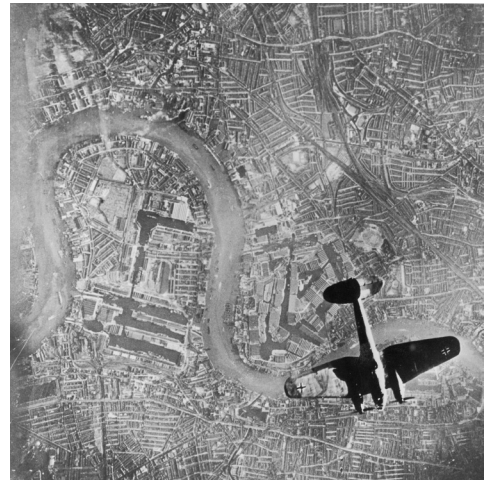
Duitse bommenwerper boven Londen, sept.40

Wanneer Hitler wordt geconfronteerd met dit hardnekkige verzet, beslist hij op 17 september om operatie Seelöwe uit te stellen. De bombardementen gaan door, maar de Duitsers bombarderen vanaf oktober uitsluitend 's nachts om zo hun verliezen te beperken. De Führer besluit vanaf 1941 om zijn krachten te concentreren met het oog op de invasie van de USSR en vanaf dat ogenblik zal de intensiteit van de luchtaanvallen boven Engeland sterk verminderen.