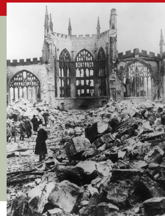
Coventry na de Duitse bombardementen

3° Van 7 september tot 31 oktober: zware bombardementen op Londen en andere Engelse steden..