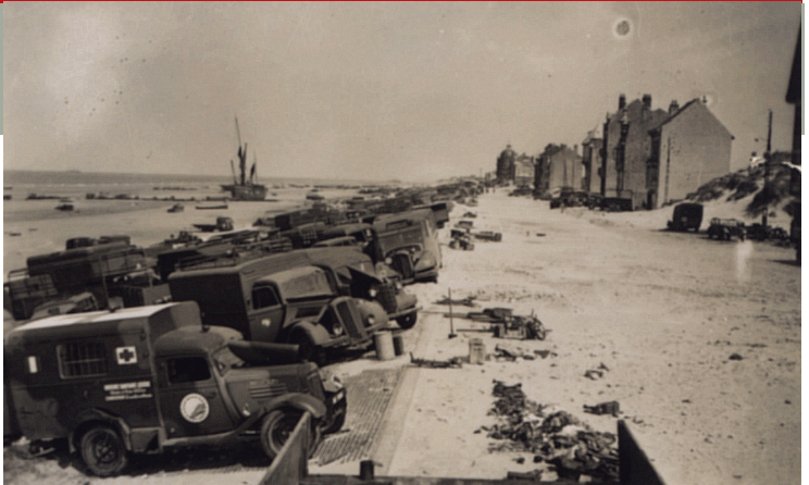
Materiaal dat de geallieerden tijdens de terugtocht in Duinkerken op de stranden achterlieten

De troepen van het BEF ( British Expeditionary Force ) maken gebruik van de korte pauze geboden door de vertragingsoperaties en het hergroeperen van de Duitse divisies. In Duinkerken schepen ze opnieuw in: het begin van operatie Dynamo. Van 26 mei tot 3 juni evacueren 850 schepen van verschillende types (visserssloepen, oorlogsschepen, plezierjachten, enz.), ongeveer 338.000 geallieerde soldaten, onder wie enkele duizenden Belgen, naar Engeland. De schepen krijgen vanuit de lucht de nodige bescherming van de Royal Air Force . Meer dan 35.000 manschappen worden desalniettemin gevangen genomen en een grote hoeveelheid materieel gaat verloren (kanonnen, vrachtwagens, pantservoertuigen) maar de operatie is toch een succes voor de geallieerden