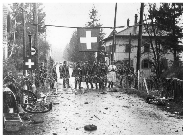
Zwitserse grens, 1944-45

Zwitserland wordt na de Eerste Wereldoorlog lid van de Volkenbond en krijgt het speciale statuut van “differentiële neutraliteit”. Dit betekent dat het land wordt vrijgesteld van deelname aan een gezamenlijke militaire actie, maar dat er wel wordt gerekend op een Zwitserse bijdrage aan eventuele commerciële en financiële sancties tegen een staat die het verdrag zou schenden. Tijdens het interbellum zien vijandige machtsblokken het licht in Europa en dit zet Zwitserland ertoe aan een statuut van “volledige neutraliteit” op te eisen. Het land verschuilt zich achter dit nieuwe statuut om niet te hoeven deelnemen aan de sanctiepolitiek waarvoor in 1936 wordt gepleit. Die sancties zijn zowel gericht tegen Italië, nadat dit land Abessinië was binnengevallen, als tegen de strijdende partijen in de Spaanse burgeroorlog. Daarnaast tracht Zwitserland zijn territoriale integriteit te bewaren en het land onderhoudt dan ook een groot leger dienstplichtigen. Er worden grote sommen geld uitgegeven om de uitrusting van deze troepenmacht te moderniseren. In augustus 1939 neemt de dreiging van een