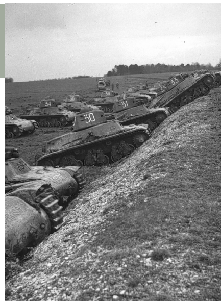
Lichte Hotchkiss-tanks M. 39 tijdens manoeuvres

Het Franse leger telt in maart 1940 meer dan 2.775.000 gemobiliseerde manschappen, en wordt daarom beschouwd als één van de sterkste strijdkrachten ter wereld. De Generale Staf hangt nog steeds de theorieën van de Eerste Wereldoorlog aan. De machinegeweren zijn verouderd en het machinepistool is nauwelijks terug te vinden in de Franse regimenten. De antitankkanonnen blijken te licht om tegen de krachtige Duitse pantsers op te boksen. In mei 1940 bezit het Franse leger wel degelijk een groot aantal pantservoertuigen, die voor het overgrote deel zelfs beter beschermd en bewapend zijn dan hun Duitse tegenhangers, hoewel met beperktere actieradius. Efficiëntie ontbreekt echter: ze worden in verspreide slagorde aangewend, zonder luchtdekking en meestal als begeleiding voor de infanterie. Deze tactiek zal niet opgewassen blijken tegen de Duitse Blitzkrieg .