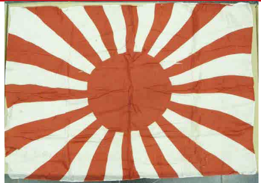
Vlag van de Japanse marine, ca. 1941. De traditionele Japanse vlag, de hi no maru, komt sinds 1889 in deze versie van de marine voor, met zestien stralen.

Het geallieerde antwoord blijft niet uit, met Britse troepen in India, Chinese troepen in het westen en Amerikaanse vliegdekschepen in de Stille Oceaan. In november 1942 behalen die laatsten hun eerste grote overwinning op het eiland Guadalcanal.