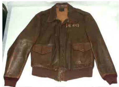
Vliegjeker model A2 voor een Amerikaanse piloot van de Flying Tigers, 1942.

In 1942 vertrekt de kleine medische eenheid – verbonden