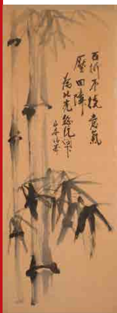
Japans schilderij met Oost-Indische inkt op papier “Verering van Hitler”, ca. 1941. Het werk draagt de signatuur van de kunstenaar, Yamamoto Seiho. Het werd door de Belgische oorlogscorrespondent Nic Bal in de ruïnes van de Rijkskanselarij in Berlijn teruggevonden.

Het pact, dat in 1936 wordt ondertekend, wil de krachten bundelen tegen de Komintern (de IIIde Communistische Internationale) en bevat een clausule van verdediging tegen de Sovjet-Unie. Duitsland en Japan worden in de loop van de volgende jaren in dat verdrag bijgetreden door Hongarije, Italië en Spanje.