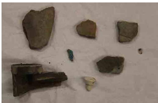
Atoombom. Puin uit Hiroshima. De stukken van dit dak komen van een woning die op 6 augustus 1945 door de Amerikaanse atoombom op de Japanse stad Hiroshima werd verwoest.

Op 9 augustus 1945 vormt de intrede van de Sovjet-Unie in de oorlog tegen Japan het tweede en belangrijker element in de ommekeer. Het Rode Leger rukt vanuit het noorden in enkele dagen tijd honderden kilometers op. Japan start de onderhandelingen over de capitulatie met de Verenigde Staten. Op 2 september 1945 komt op het dek van de Amerikaanse kruiser Missouri een einde aan de oorlog.